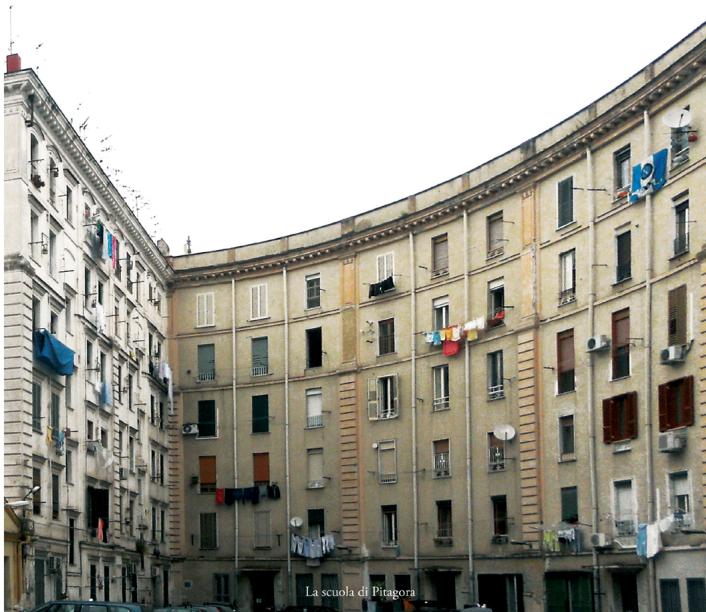
La scuola di Pitagora

PROGETTI E REALIZZAZIONI DAL XVIII AL XX SECOLO