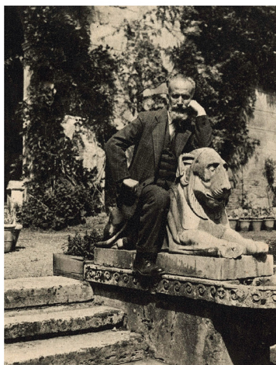
La scuola di Pitagora editrice

«Un signore che si diverte a pubblicare dei libri belli»